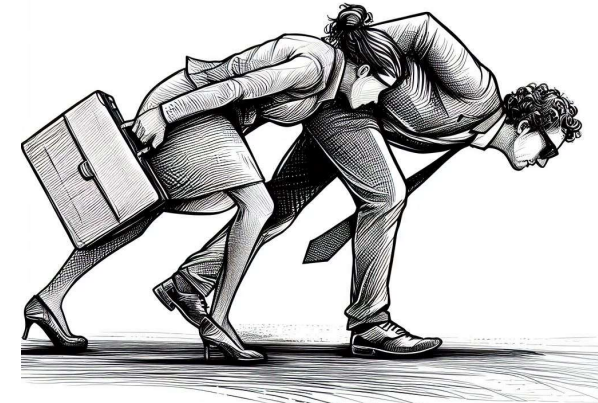
Kuva luotu DALL 3 E tekoälyllä